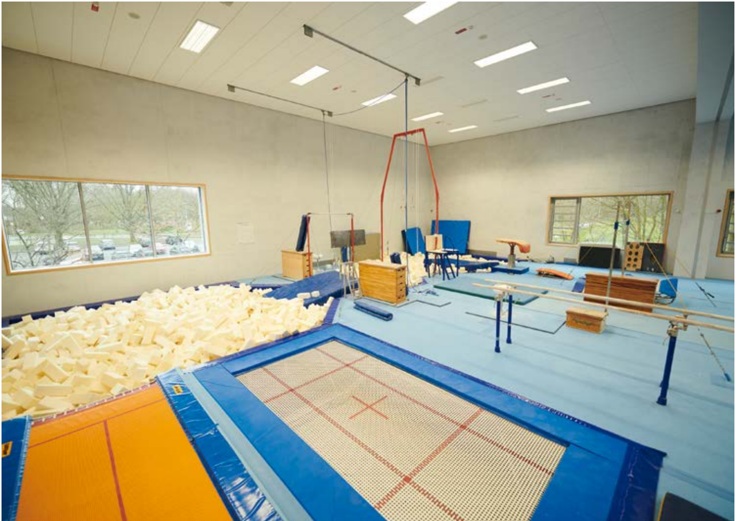
Die leere Gerätturnhalle im Neubau des Sportleistungszentrums während der Zwangspause. Seit dem 14. April wird hier wieder trainiert.

Seit dem 14. April können 61 Olympia- und Perspektiv-Kader in den olympischen und paralympischen Sportarten wieder im Sportleistungszentrum (SLZ) Hannover und im Olympiastützpunkt (OSP) Niedersachsen unter Beachtung der weiterhin für die gesamte Bevölkerung geltenden Sicherheitsvorschriften trainieren. Darüber hinaus können die Schwimmer, Triathleten und Wasserballer übergangsweise im Fössebad in Hannover-Linden trainieren, bis die jährlichen Wartungsarbeiten in der SLZ-Schwimmhalle, die seit Ende März vorgezogen durchgeführt werden, abgeschlossen sind.