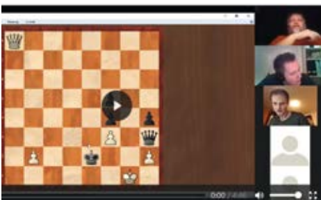
Online-Schachturnier des ESV Rot-Weiß Göttingen . Foto: ESV Rot-Weiß Göttingen

Der sportliche Wettkampf muss auch im Zuge der Corona-Krise nicht ruhen. Der Schachbezirk Südniedersachsen , der Schachverein Osnabrück , der ESV Rot-Weiß Göttingen und der SC Turm Lüneburg haben ihre Wettbewerbe kurzerhand zu Online-Formaten auf der Plattform lichess.org umgewandelt. Dort wurde auch die Onlinemeisterschaft 2020 der Niedersächsischen Schachjugend ausgetragen. Der Schüler-Ruder-Verband Niedersachsen startete gemeinsam mit dem Bund Deutscher Schülerruderer eine Ergometer-Challenge. Der Wettbewerb, bei dem in jedem Monat eine andere Streckenlänge gewertet wird, wird bis in den Juli ausgefahren. Teilnehmen können alle Schüler- und Vereinsrunderinnen und -runderer, die einen Ergometer zu Hause haben. Der Nie-