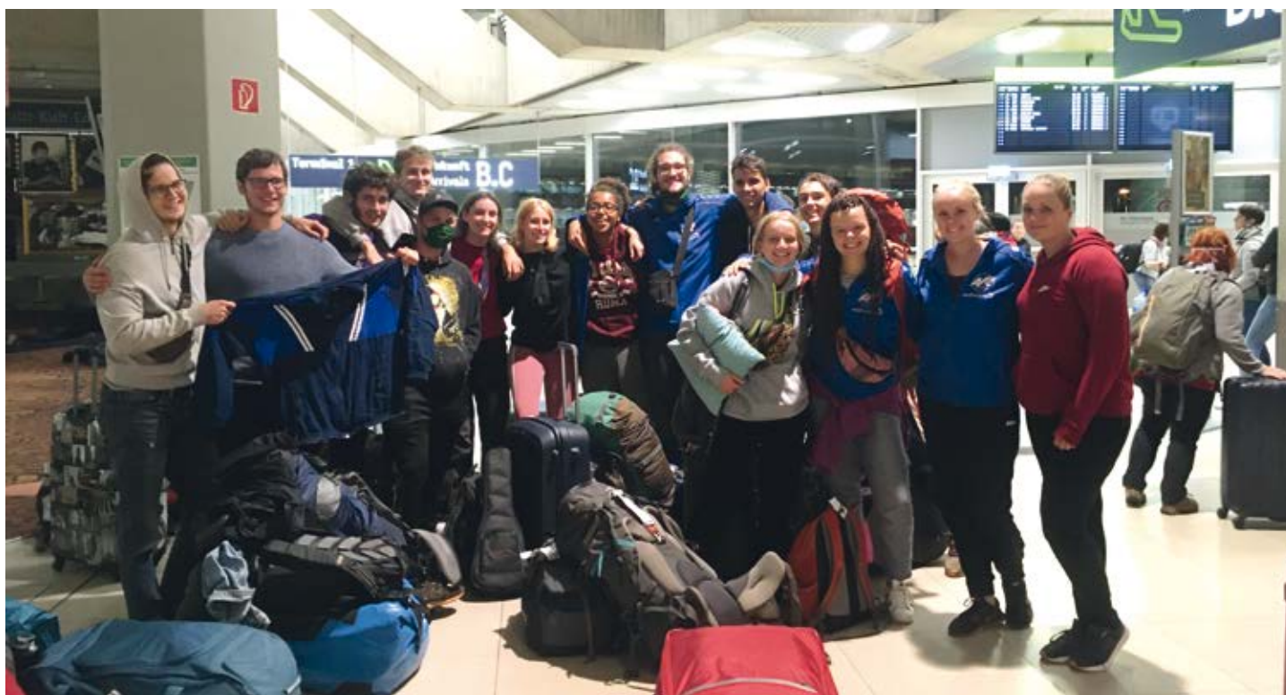
Die letzten 15 Freiwilligen aus Afrika treffen im Rahmen der Rückholaktion am Kölner Flughafen ein.