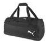
Puma teamGOAL 23 Sporttasche Teambag Art.Nr.: 76862-03 Größen: L 34,95 € 17,50 €

Offizieller Partner des LandesSportBundes Niedersachsen