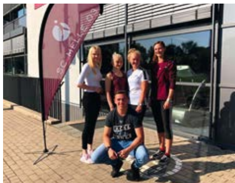
Die Freiwilligendienstleistenden des SC Melle 03.

Webcam statt Augenkontakt mit den Sportlerinnen und Sportlern, Einsamkeit im Seminarraum statt tobender Kinder in der Sporthalle und WhatsApp statt direktem Austausch. Die Sportvereine und