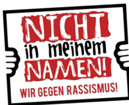
Der Slogan des TTC Förste.

Aufgrund der starken Resonanz soll die Kampagne auf die weiteren Mannschaften des Vereins und vielleicht auf einen anderen Tischtennisverein in Südniedersachsen ausgedehnt werden. „Wir wollen in Ligaspielen