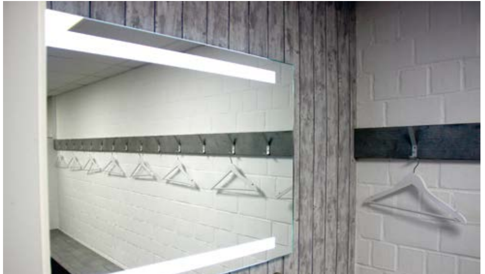
Sanierte Umkleidekabine des TV Letter.

Seit dem 8. April 2020 gelten in Niedersachsen zunächst bis zum 30. September 2020 höhere Wertgrenzen für die Vergabe von Bau-, Liefer- und Dienstleistungsaufträgen durch öffentliche Auftraggeber.