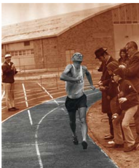
Shaul Ladany im Trikot von Israel.

Unter dem Titel Sport mit Courage ist der LSB daher seit 2012 aktiv. Wir beraten unsere Landesfachverbände, Sport-