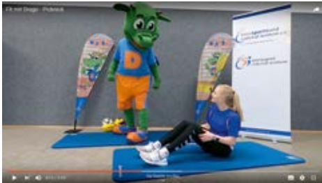
„Fit mir Drago“: Das Angebot der Sportjugend Grafenschaft Bentheim.

Im „ASC Kids Channel“ des ASC Göttingen stehen zusätzlich zahlreiche Videos zur Verfügung, die von Erzieherinnen und Erziehern, Freiwilligendienstleistenden und anderen Ehrenamtlichen des ASC speziell für Kinder erstellt wurden.