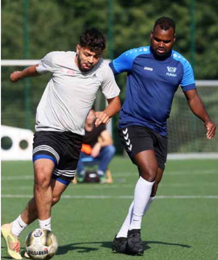
Fünf Mannschaften traten beim Jubiläumsturnier gegeneinander an.