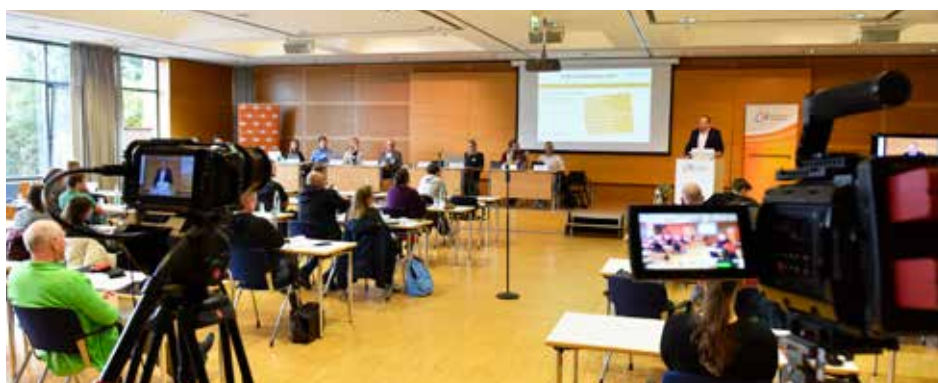
Der Livestream wurde vom Team MedienSportWelten und dem LSB zur Verfügung gestellt.