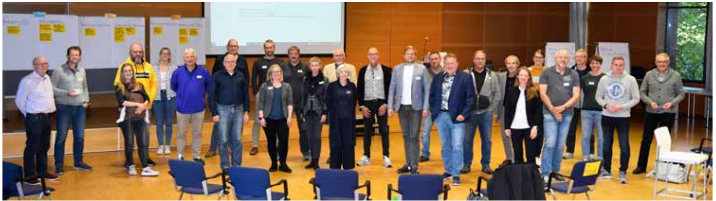
Die Mitglieder der Präsidialkommission-Arbeitsgruppen.

Rund 30 Personen haben sich über die bisherige Arbeit in den fünf Arbeitsgruppen der Präsidialkommission „Sportorganisationen vor Ort“ ausgetauscht. So liegen inzwischen Vorschläge für freiwillige Kooperationsformate der Sportbünde wie auch für die Arbeitsweise vor Ort vor. Formuliert wurde der Wunsch nach mehr Flexibilität in der Aufgabengestaltung.