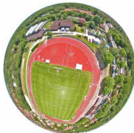
Der Sportpark von oben.

Obwohl äußerste Sparsamkeit bei der Errichtung des Sportplatzes geboten ist, bemüht man sich doch stets um Solidität. Bei der Außeneinfriedung des Grundstückes entscheidet man sich für dauerhaftere Betonpfosten, versehen mit Betonplatten, statt eines Drahtzauns mit Eichenpfählen. Zur Eröffnung des 17. Kreisturnfestes am