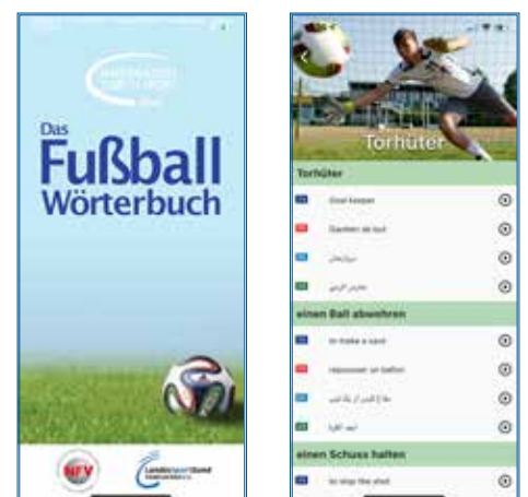
Die neue Fußballwörterbuch-App

In dieser langfristigen Perspektive sieht auch der LSB-Vorstandsvorsitzende Reinhard Rawe eine notwendige Voraussetzung für gesellschaftliche Veränderungen: „Projektarbeit bedeutet immer: Es gibt einen Anfang und es gibt ein Ende. Ich kann nur hoffen, dass das Projekt zur Regelarbeit wird und seinen Projektstatus verliert. Denn Vielfalt muss zur Normalität werden.“ Dass sich das Projekt in fünf Jahren zu einer Erfolgsgeschichte entwickeln konnte, verdankt es zu einem wesentlichen Anteil der langjährigen finanziellen Förderung und Begleitung des Projekts durch das Bundesministerium des Innern, für Bau und Heimat, dem Bundesamt für Migration und Flüchtlinge und dem Deutschen Olympischen Sportbund im Rahmen des Bundesprogramms „Integration durch Sport“. Mit den Mitteln des Bundesprogramms konnte 2021 auch die mehrsprachige Fußballwörterbuch-App auf den Weg gebracht werden.