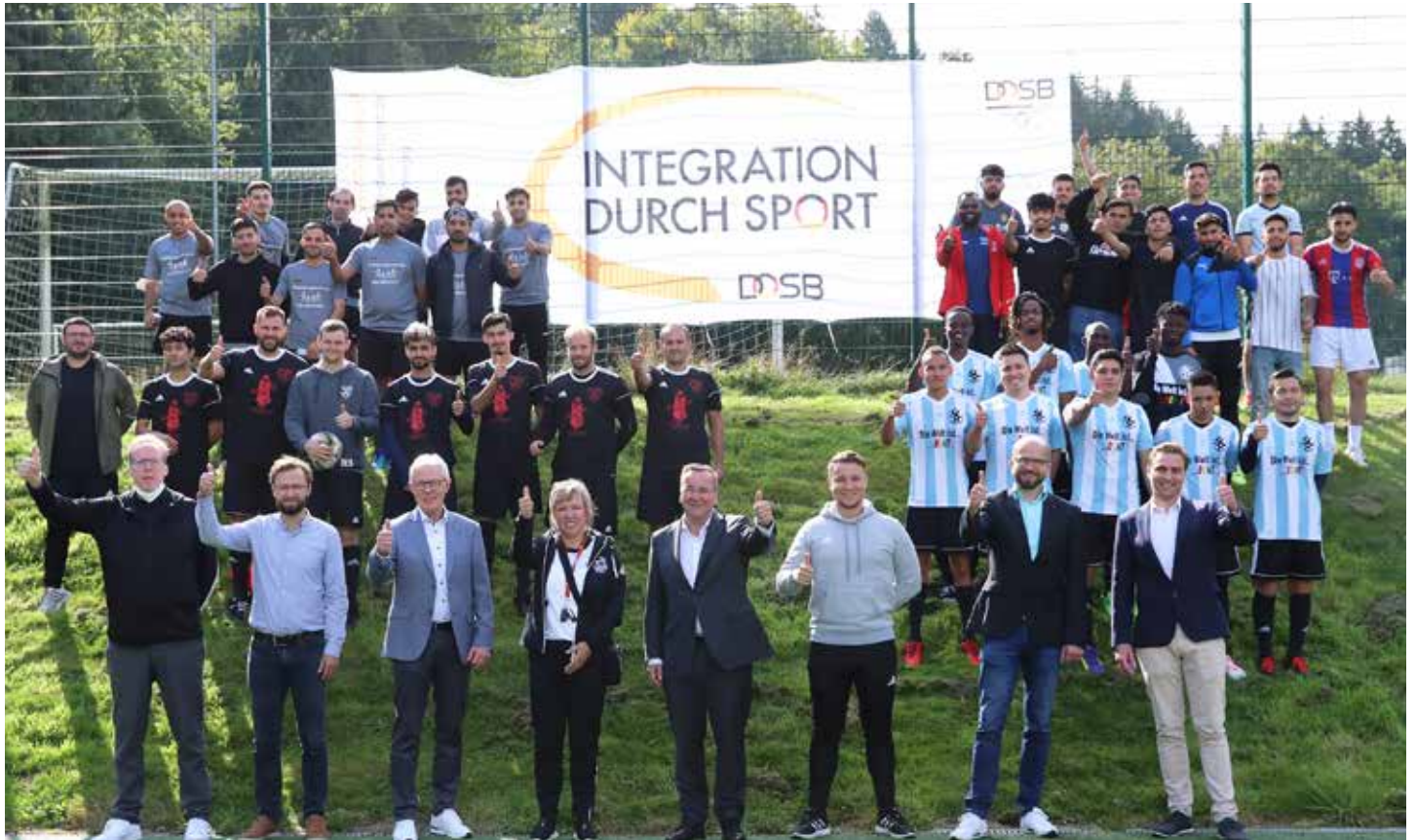
Daumen hoch für das Projekt Soccer Refugee Coach.