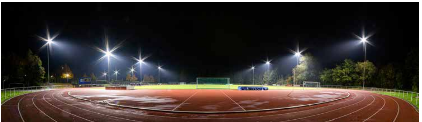
Modernisierte Flutlichtanlage im Stadion des VfL Stade.