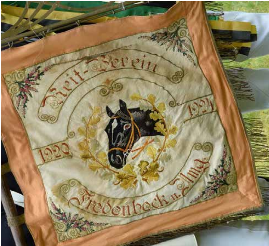
Die alte Standarte des Reitvereins Fredenbeck.