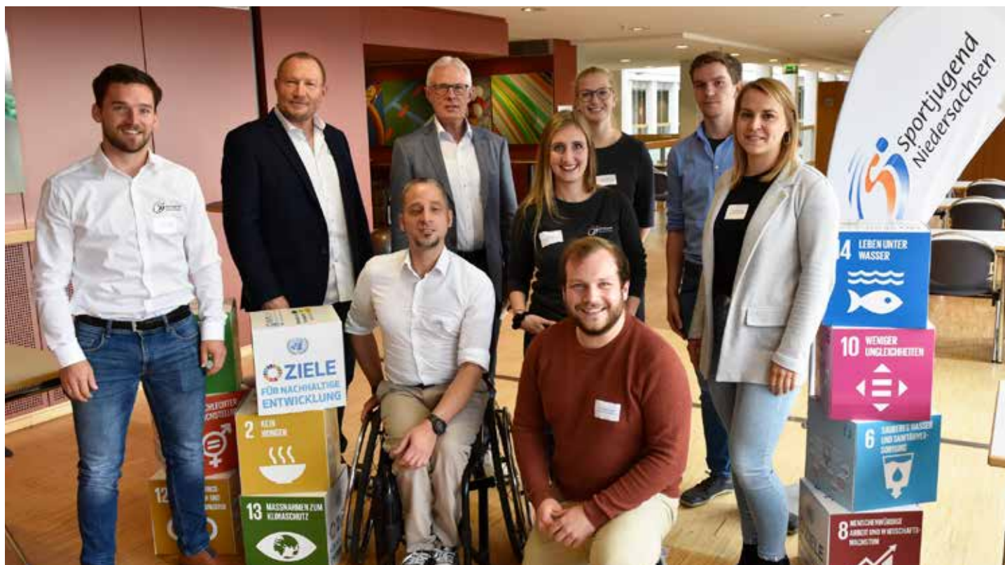
Der Vorstand der Sportjugend Niedersachsen.