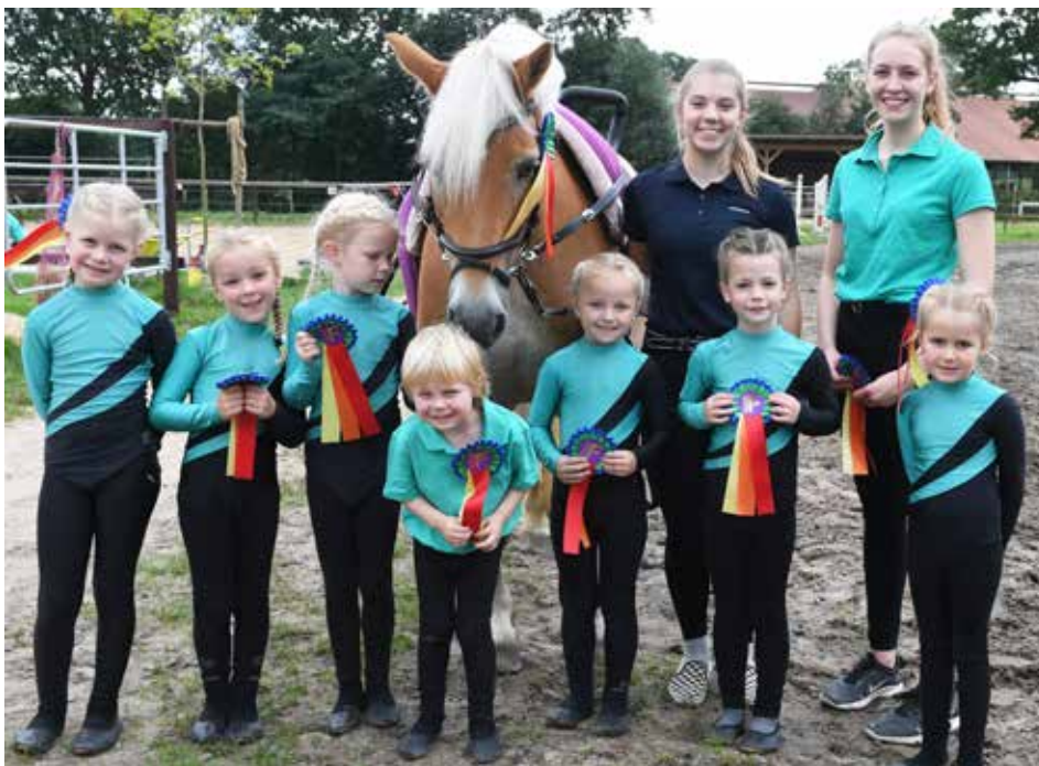
Voltigiergruppe des Reitvereins Fredenbeck.

„100 Jahre Reitverein Fredenbeck spiegelt nicht nur die wechselvolle Geschichte im Umgang mit dem Partner Pferd wider, sondern auch eine wandelnde Stellung in Sport und Gesellschaft“, untermauerte Hauschild im Vorwort der Festschrift zum Jubiläum. So sei das Vereinsleben mit der Gründung in Fredenbeck und Umgebung ab 1920 zunächst mit seinen jährlichen Umzügen auf die Mitgestaltung des Dorflebens geprägt gewesen. In der Anfangszeit