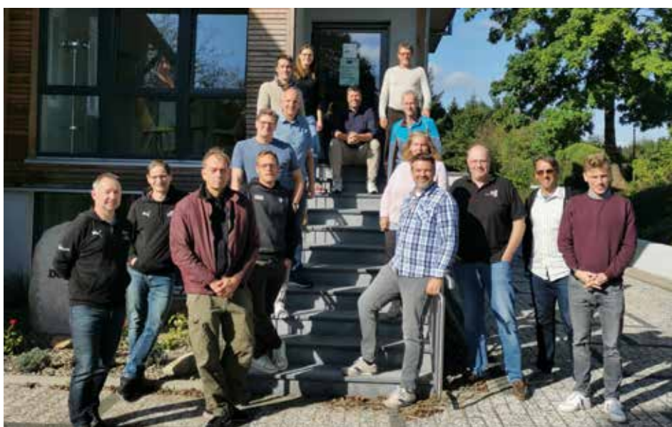
Teilnehmerinnen und Teilnehmer des jährlichen LSB-Trainerseminars.

Die beiden Referenten des ersten Seminartages sind Teil der Hildesheimer Projektgruppe und engagieren sich seit langem im Leistungssport. Christian Hungerecker war Landestrainer des niedersächsischen Hand-