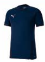
Puma TeamGOAL 23 Jersey Art.Nr.: 704171-06 Größen: S - 3XL 19,95 € 10,00 €