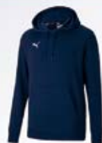
Puma TeamGOAL 23 Training Sweat Art.Nr.: 656580-06 Größen: S - 3XL 39,95 € 20,00 €