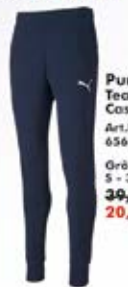
Puma TeamGOAL 23 Casuals Pants Art.Nr.: 656582-06 Größen: S - 3XL 39,95 € 20,00 €