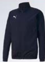
Puma TeamGOAL 23 Training Jacket Art.Nr.: 656561-06 Größen: S - 3XL 39,95 € 20,00 €