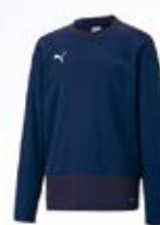
Puma TeamGOAL 23 Training Sweat Art.Nr.: 656478-06 Größen: S - 3XL 34,95 € 17,50 €