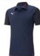
Puma TeamGOAL 23 Sideline Polo Art.Nr.: 656577-06 Größen: S - 3XL 29,95 € 15,00 €